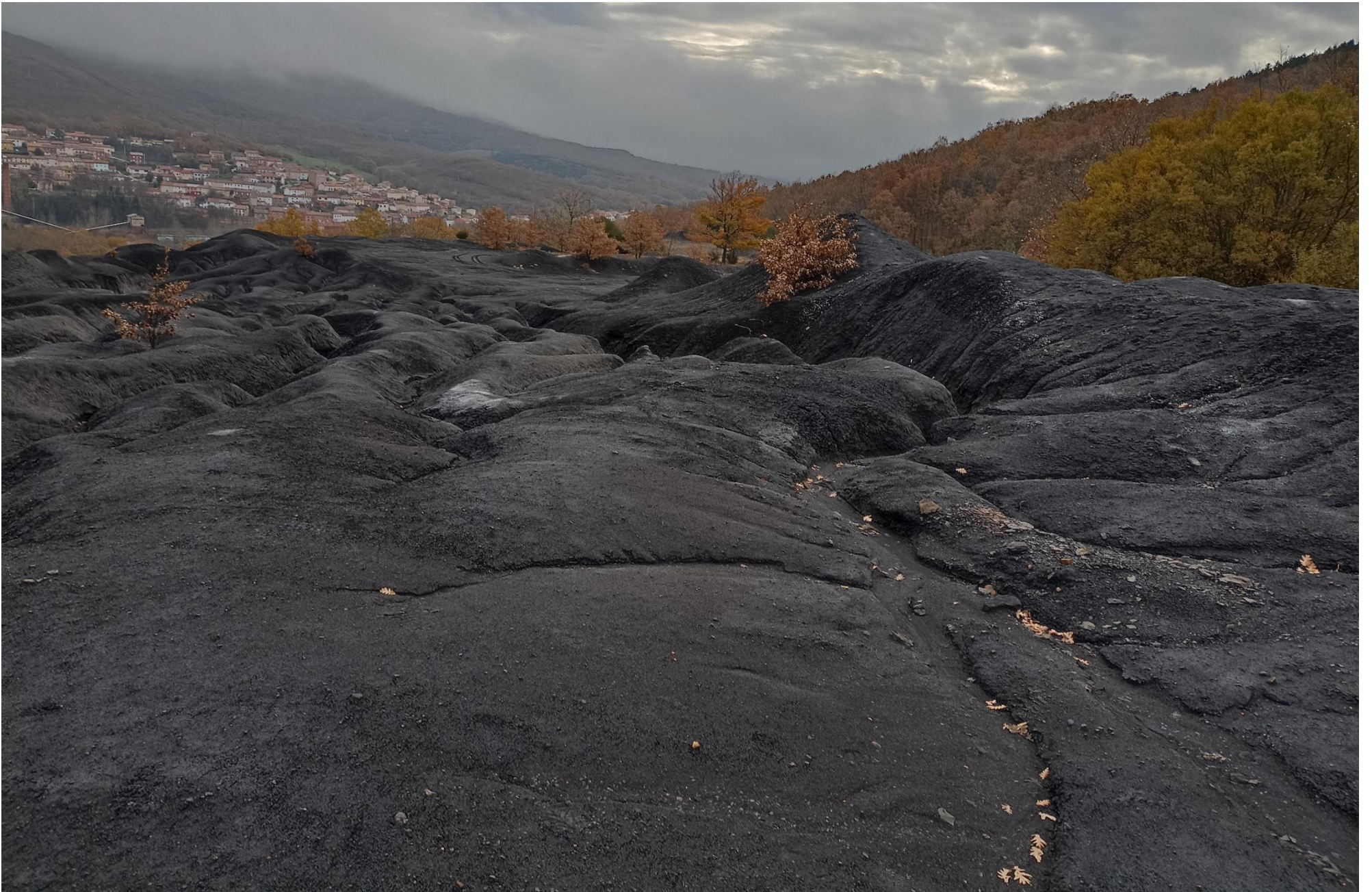
PROCESO (Zona cercana al río):