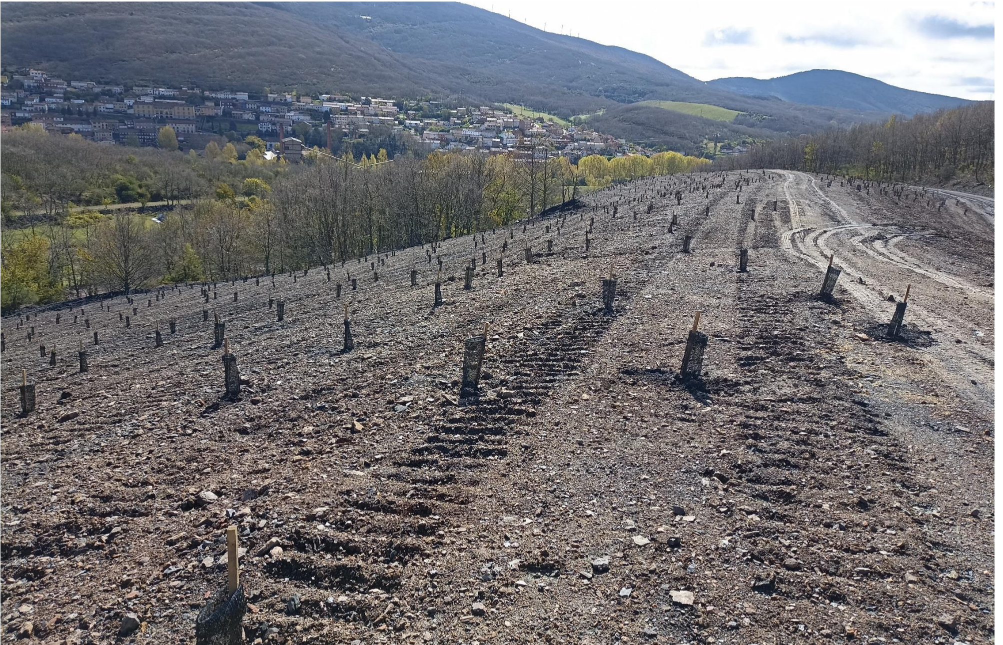
SITUACIÓN FINAL (Resto de la escombrera):